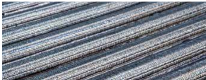
Panel con recargo Unifuse 180

Marconiweg 16 | 3225 LV Hellevoetsluis | The Netherlands T: +31 88 27 84 539 E: wsi-europe@azz.com W: www.azz.com/wsi-europe