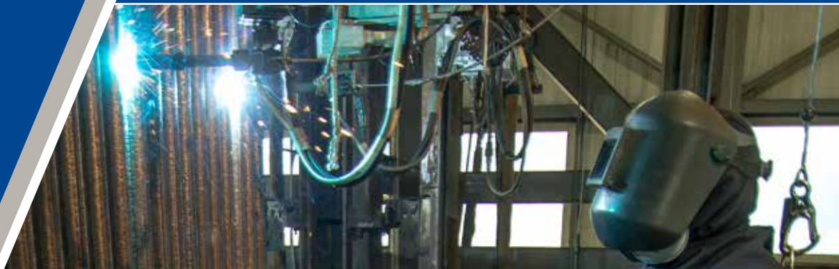
Sistema de fijación para el recargue