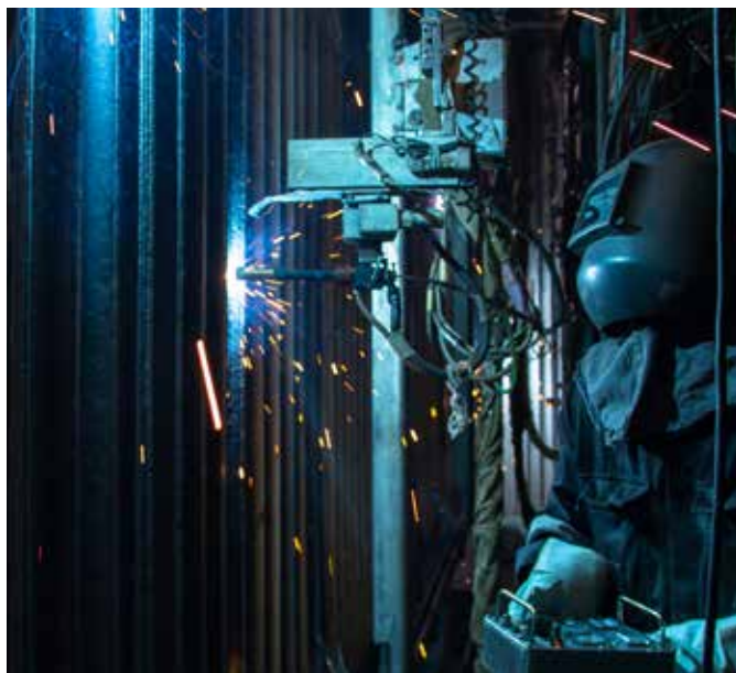
Reparación en una caldera de incineración

El mayor sector de actividad de AZZ WSI es el relacionado con la prestación de servicios sobre el terreno, dentro de la caldera. Ninguna otra empresa puede ofrecer el soporte, el equipamiento y el personal de logística para renovar áreas muy amplias en los plazos más cortos. La principal ventaja comercial para los clientes es que el recargo dentro de la caldera suele ser menos costoso que la sustitución de paneles en sí.