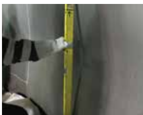
“bulges” na parede lateral e trincas externas

Temos várias soluções para os problemas, que podem melhorar a operação confiável de tambores de coque: