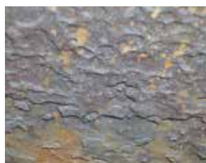
corrosão e trincas

A AZZ WSI é uma empresa de serviços especializados voltados para o Setor de Energia.