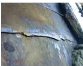
trinca em solda circunferencia