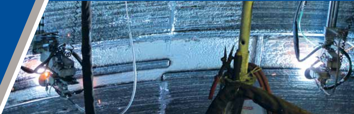
Reforço Estrutural de uma Unidade de Coqueificação Retardada