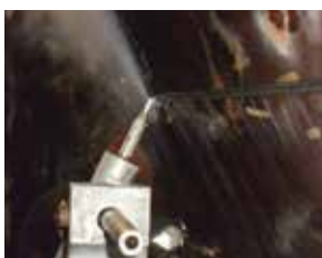
remoção ou modificação do cone e do topo