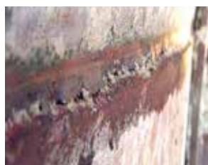
trinca na saia e substituição da saia