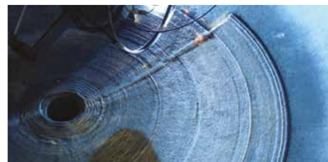
Esferas y domos

Los entornos operativos difíciles, combinados con las presiones para reducir el impacto ambiental de la producción, pueden acelerar la corrosión y la erosión de los equipos de procesos, así como de los componentes esenciales de calderas, cámaras y recipientes. Esto puede provocar fallos que pongan en peligro la fiabilidad de la unidad y el funcionamiento seguro de la planta.