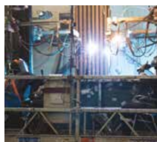
Recubrimiento de paneles