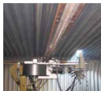
Reubrimiento de paredes de agua