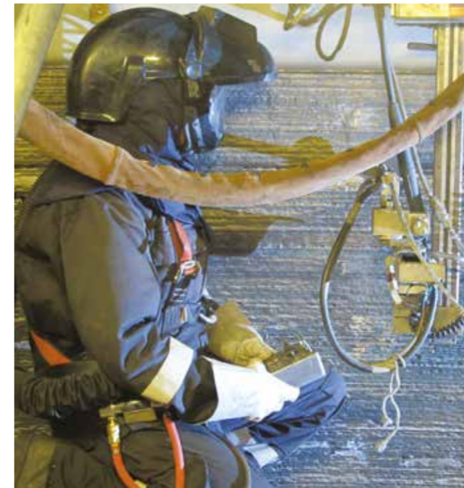
Operarios equipados con EPPs necesarios

Nuestro compromiso con HSE se ve impulsado por nuestro personal especializado a tiempo completo, nuestro liderazgo en todos los niveles y nuestros programas y certificaciones exclusivos de control de calidad.