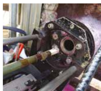
Recubrimiento interior de Boquillas