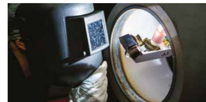
Modelos y maquetas

Nos esforzamos por determinar las mejores soluciones técnicas para nuestros clientes, teniendo en cuenta los requisitos de seguridad, los plazos de los proyectos y la calidad. Aplicamos el mismo nivel de detalle en todo lo que hacemos, independientemente de si se trata de realizar un análisis de elementos finitos FEA para predecir y minimizar la distorsión asociada a nuestro proceso de soldadura o de demostrar un proceso innovador con una maqueta.