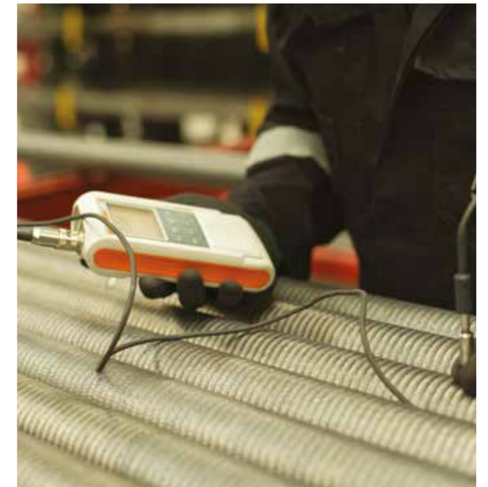
Control de espesores

En consecuencia, hemos adquirido una ventaja competitiva sin igual en el mercado. Para AZZ/WSI, la seguridad es la prioridad número uno.