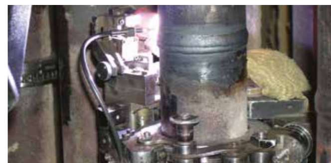
Soldadura orbital en tuberías

Es necesario realizar mejoras y reparaciones estructurales para proteger la integridad de los equipos y conseguir que las plantas operen con la máxima eficacia. Somos líderes en la optimización y la prolongación de la vida mecánica de una amplia variedad de componentes de procesos básicos. Nuestro objetivo principal es proporcionar soluciones permanentes de reparación que resuelvan los problemas de raíz en lugar de sustituir componentes con desgaste prematuro. Empleamos tecnología de soldadura automatizada para reparar, reacondicionar y reforzar la estructura de los equipos. Nuestro personal especializado y altamente calificado, disponible a jornada completa, se encarga de proporcionar todos estos servicios.