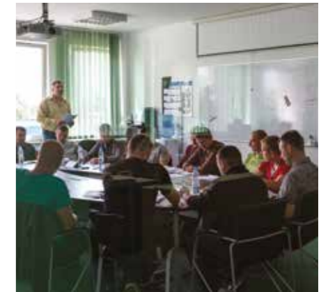
Formación de empleados

Todos los especialistas de AZZ WSI están cualificados según EN 287-1, EN 1418 y EN ISO 14732 o ASME, y el alcance de los trabajos se realiza de conformidad con los requisitos de la Directiva sobre equipos a presión 97/23/CE y de los códigos aplicables de fabricación y diseño para los equipos a presión. Contamos con un Programa de garantía de la calidad certificado por EN-ISO 3834-3, AD-Merkblatt HP0 (TRB 200), TRD 201 y ASME U & S. Todos los procedimientos de soldadura respetan los requisitos de EN-ISO 15614-1 y 7 o de EN 288 y TÜV Merkblatt 1156/1166 o ASME BPVC.