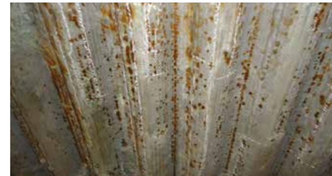
Pared de agua tras la prueba del sulfato de cobre

En el caso de la exposición del metal de base, se aplicarán reparaciones puntuales al recargue después de la preparación de la superficie de la zona. En el supuesto de que sean necesarias reparaciones mayores, AZZ WSI puede ofrecer una solución de reparación usando la tecnología Unifuse , que se ha aplicado con éxito en calderas durante más de treinta años y ofrece una solución eficiente al ataque de la corrosión generada por los productos de la combustión en las calderas y por los gases de escape calientes que generan los sistemas de recuperación del calor residual.