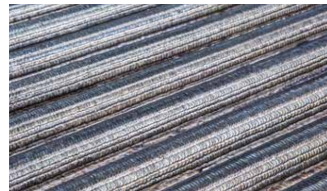
Unifuse 180: prolongación de la vida útil de los paneles de las calderas

El proceso Unifuse 180 ofrece una protección de alta calidad de la superficie de los paneles. Nuestra fábrica cuenta con la tecnología GMAW y con sistemas de montaje de paneles que permiten recrer paneles planos de hasta 18 m de largo y 2 m de ancho.