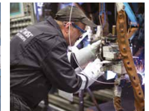
Línea de tubos Unifuse 360