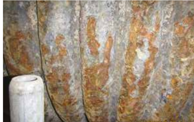
Corrosión en la cara expuesta al fuego de una caldera de carbón

AZZ WSI ha sido elegido para aportar recargue con soldadura en muchas centrales térmicas de carbón usando Unifuse 622 . Unifuse con aleación 622 cuenta con un historial de rendimiento demostrado frente a la corrosión, la corrosión/erosión y la fatiga térmica, y es especialmente eficaz a la hora de proteger las paredes de agua ante la corrosión en condiciones de combustión baja de óxidos de nitrógeno (NOx).