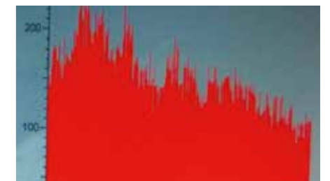
Análisis cualitativo y cuantitativo (por dispersión de energía de rayos X)

Nuestro proceso automático ofrece un recrecimiento con soldadura de alta calidad. Entre la cualificación y los parámetros del proceso que hemos desarrollado se incluyen ensayos destructivos para comprobar las características del recrecimiento con soldadura, como la disolución en el material de base, que se mide con precisión en todo momento con el control de los parámetros del proceso. También es importante mantener al mínimo el contenido férrico del material de base, ya que es el responsable del deterioro de la corrosión.