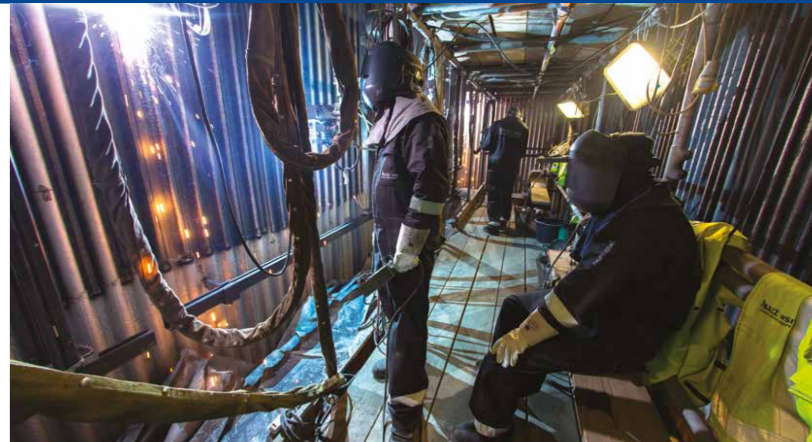
Reparación de pared de agua en una instalación de producción de energía a partir de residuos