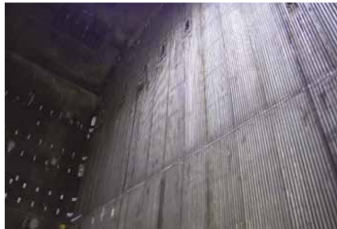
La reparación de AZZ WSI con Unifuse 622 prolongó la vida útil de la caldera de carbón