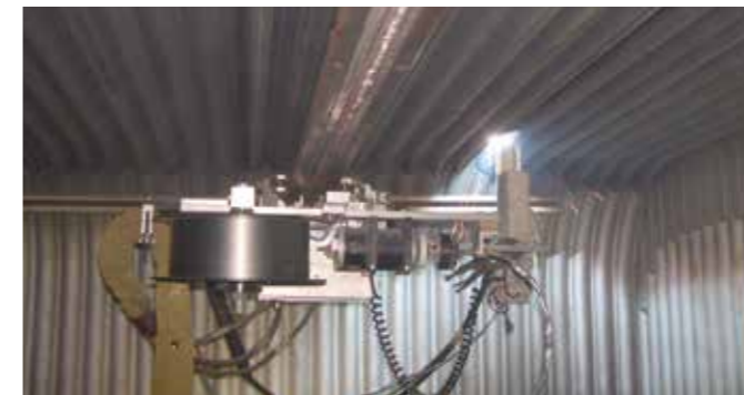
Si los daños son extensos, habrá que realizar un recargue con soldadura Unifuse automático para recuperar el espesor necesario de la protección anticorrosiva