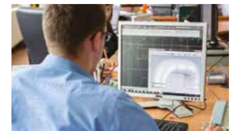
Una completa gama de análisis

Nuestro departamento de ingeniería ofrece una gama completa de análisis, tales como mitigación de la distorsión, análisis de la tensión, estabilidad estructural y procedimientos especiales de soldadura para asegurar un rendimiento óptimo en todo momento, tanto si se trabaja en la fábrica como in situ. Además, ingenieros altamente capacitados y especializados en mecanización, metalurgia, corrosión y soldadura se esfuerzan por determinar las soluciones técnicas más adecuadas para nuestros clientes.