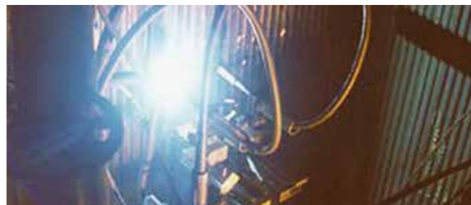
Reparación sobre el terreno en una caldera de recuperación de leñas negras

protegidos con Unifuse con aleación 309, 310 o GR383, usando el proceso GMAW/GTAW patentado de AZZ WSI, es una solución eficiente y a largo plazo para el problema de la corrosión de los recalentadores, además de eliminar la necesidad de soldaduras con metales diferentes.