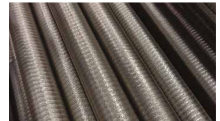
Unifuse 360: protección de los tubos de las calderas

El proceso Unifuse 360 ofrece protección frente a la corrosión y la erosión en todo el perímetro de los tubos de las calderas. Nuestra fábrica puede aplicar un espesor de recrecimiento de 1,2-3,0 mm (o incluso más si es necesario con un recargue de varias capas) a los diseños de los tubos y colectores de hasta 15 m de largo con diámetros de entre 21 y 273 mm.