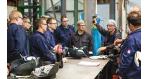
Reuniones diarias de seguridad

Es muy sencillo, la seguridad es la principal prioridad para AZZ WSI. Por ello, es fundamental el cumplimiento total de las normas de seguridad, salud y medio ambiente (HSE) en cada fase de todos los proyectos que asumimos. Un completo plan que cubre todos los aspectos de HSE respalda todas nuestras acciones, desde el análisis hasta la implementación, e incluye una completa evaluación de riesgos que refleja las certificaciones adecuadas, la planificación, las responsabilidades, la formación y el análisis de riesgos de las tareas.