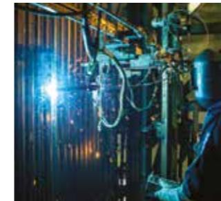
Unifuse 180: Prolongación de la vida útil de los paneles de las calderas