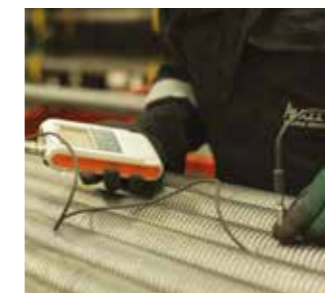
Control del espesor