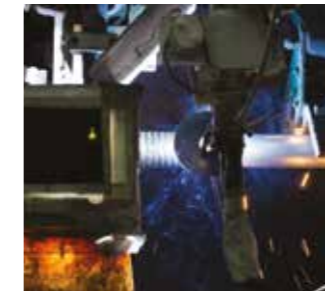
Unifuse 360: Nuestro exclusivo proceso GMAW/GTAW