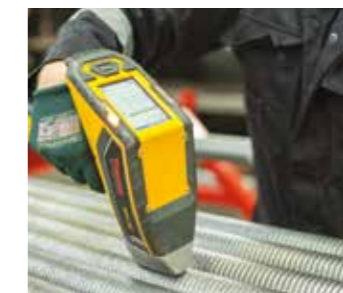
PMI para el control de la dilución