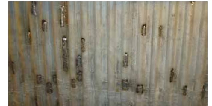
Reparaciones puntuales en un viejo recargue con soldadura 625