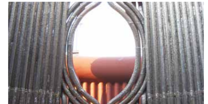
Ventanas fabricadas con tubos en espiral

Un programa de mantenimiento personalizado es la forma más rentable de proteger su equipo. Durante el programa de mantenimiento, supervisamos el rendimiento de sus equipos con regularidad.