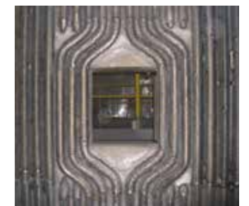
Apertura fabricada con tubos en espiral