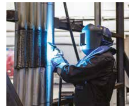
Formación de soldador