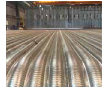
Panel fabricado con tubos en espiral