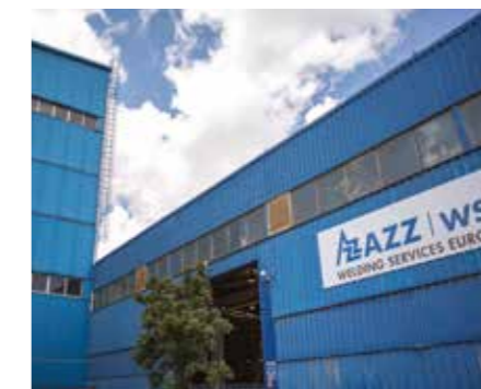
Nuestra fábrica de Radom (Polonia) con una producción continua todos los días del año.